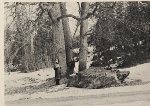
● Turun luonnonsuojelun historia alkaa Katariinanlaaksoista, missä suurten lamien suojassa on kuuluisa Katariinankivi. Tällä kivellä kuninkailinen retkikunta ateriöiti 1500-luvulla ja niin tekee myös nykyinen retkeliijä eväskoreineen ja termospulloineen.

Katariinanlaakson uninäytelmän aiheet ovat kutakinkin häihytviä. Yksi niistä näyttää riemua kiinnettämällä, nimittäin hannaan olevan suuren kiven nimi. Tunnettu suomenkielinen runo Kaarle-herttuun sotaretkestä Suomeen kertoo eräs-